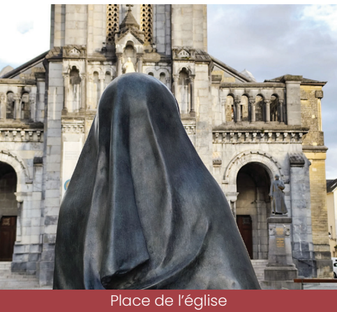
Place de l'église